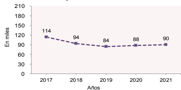
Desempleo en Agosto Ajustado Estacionalmente

La cifra de desempleo ajustada estacionalmente en agosto de 2021 fue de 90,000 personas. Esta cifra representó 3,000 personas más en comparación con julio de 2021 (87,000), y 2,000 más respecto a agosto de 2020 (88,000). La distribución porcentual de las personas desempleadas por periodo de duración de desempleo en agosto de 2021 fue la siguiente: menos de 5 semanas, 42.4%; 5 a 14 semanas, 35.5%; 15 semanas y más, 22.1%.